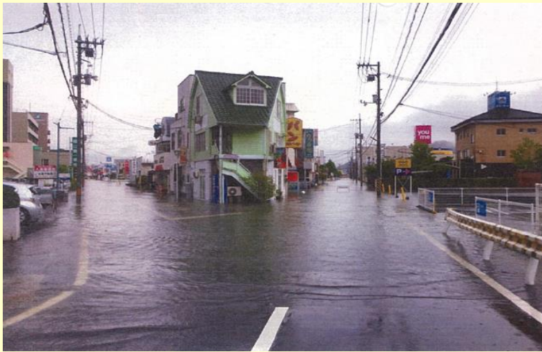
【市街地の浸水状況（南蔵王町）】