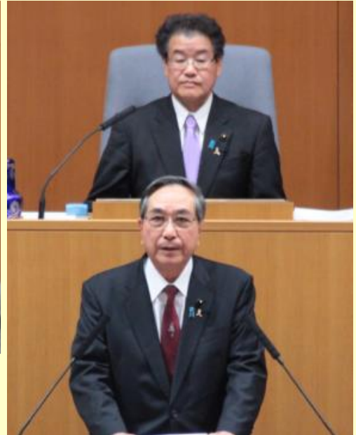
【山木新議長就任挨拶】