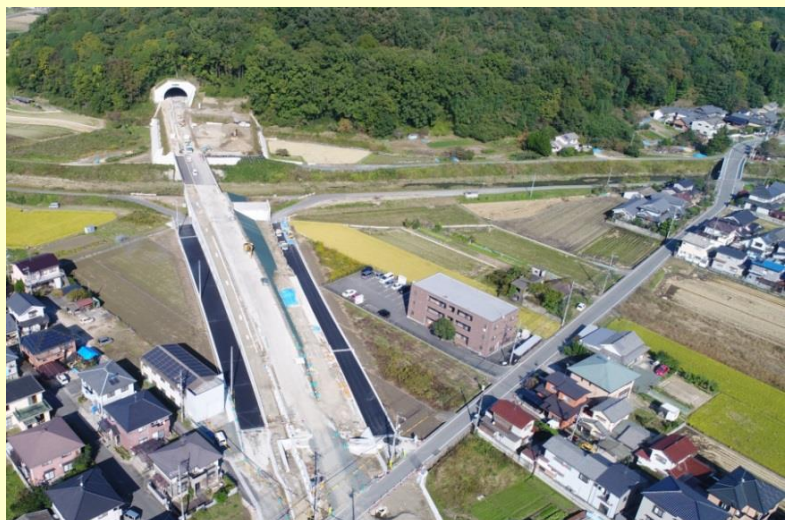
【10月末の工事の状況】