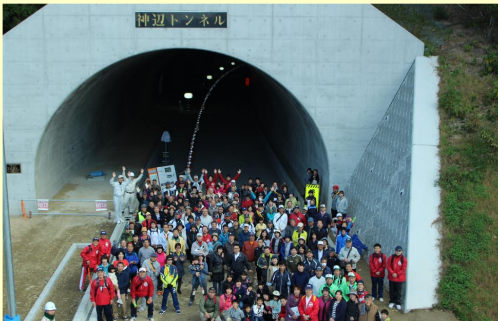
【11月12日のイベント時の風景（ドローンによる撮影）】