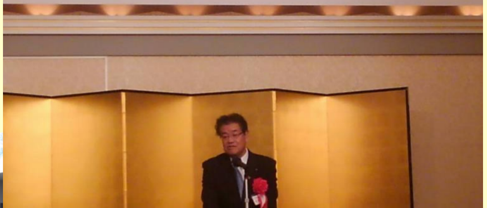
【副議長として挨拶】